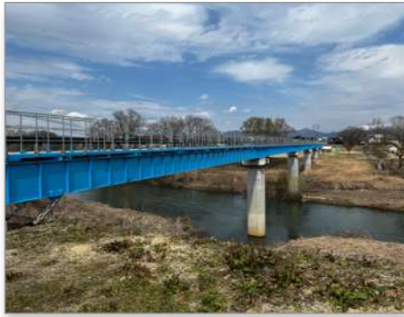
最上川を渡る樋（現在は鋼製）

直江兼続の時代に治水施設や生活用水は整備されていたが大規模な農業用水は鷹山の時代に整備されており、その史跡が残っています。一つは黒井堰でもう一つは穴堰です。