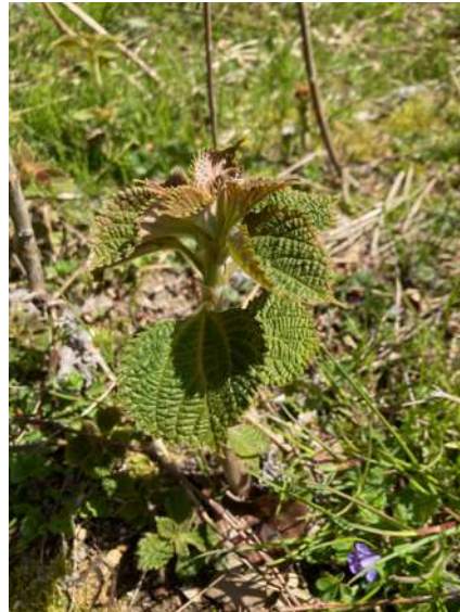
野苧麻/野カラムシ