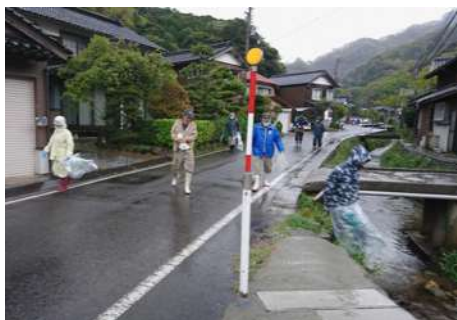
クリーン但馬10万人大作戦