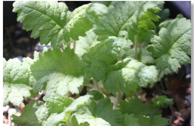
野生のサクラソウ