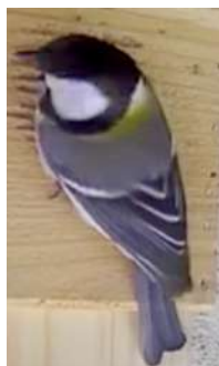
シジュウカラ？ まだ会ってない。

横の蓋を持ち上げると、中は苔が10cmくらいの厚みまで敷かれています。草の繊維か動物の毛のようなものも丸くなるように敷かれています。中心のくぼみには白い羽毛のようなものと、その下に卵らしきものが見え、くつつか有るのが見えたので、爬虫類じゃなく鳥だとわかり、胸をなで下ろしました。