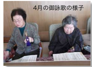
4月の御詠歌の様子

指杭のサロンは毎月お大師さんのお参りも兼ねて行っているそうです。栄養価も考えた食事と、計算や書き取りなどの認知症予防のメニューに加えて、ご詠歌も行っています。若い時から続けているご詠歌は、これがいちばんの認知症予防ではないでしょうか。歌は万病の予防になると思います。村の中の公会堂とその上にある大師堂には、急な階段を登らなくてはなりません、皆さん気をつけて、これからも元気に集まってください。皆で夏を乗り切りましょう。