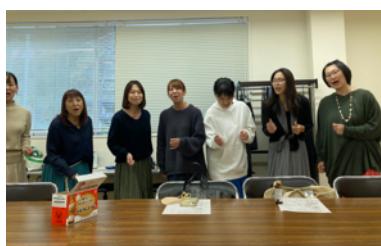
▲楽屋での練習はPPMPさん