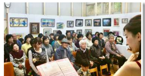
2015年 ひとさか文化祭ミニコンサート

私は昭和56年（1981）から建設省、後に国土交通省で主に水資源開発や水災害対策に関わる仕事に従事してきました。後に世界の水災害に関わることになり、土木研究所の水災害リスクマネジメント国際センター（ICHARM）を最後に、国土交通省を辞し、京都大学防災研究所水資源環境研究センターで8年余り研究を行ってきました。どれだけ皆様に役立つかわかりませんが、私の携わってきたことを中心に、何回かに分けてお伝えしたいと思います。（3Pへ）