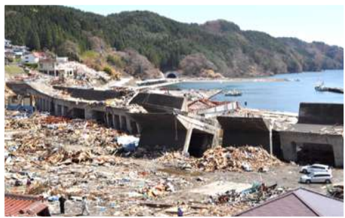
写真A: 小白浜漁港の被災した津波堤防の向こうにトンネルの入り口が見える