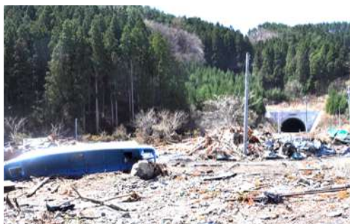
写真B: トンネルの出口付近に打ち上げられた漁船