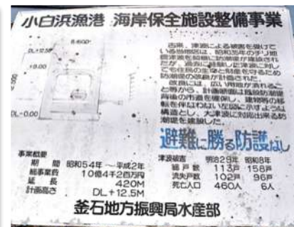
写真C: 小白浜漁港津波防潮堤の説明板