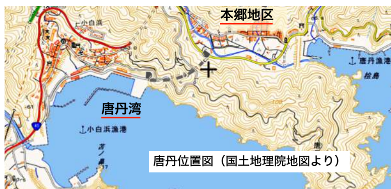
唐丹位置図

2011年3月11日に東日本の太平洋側を襲った津波は、津波対策の先進地である三陸地方の堤防を越え、壊滅的な被害をもたらしました。三陸はリアス式海岸で有名で、谷毎に浜があり集落があります。唐丹(とうに)というところでは、位置図の「+」の左上にあるトンネルで山を貫いて、隣の本郷地区の津波堤防の内陸側に短距離でアクセスできるようになっていました。津波は写真Aの唐丹湾からトンネルを通して本郷地区を襲いました。