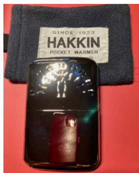
小さいけれど暖かい ハクキンカイロ mini

お正月は拍子抜けするほどの良いお天気が続きましたが、現在寒波が近づいており、この便りが届く頃は一年で最も気温の低い日になるらしいです。現在、体の方も凍結しそうなほど気温の低下を体感しています。近頃、体の芯から冷え切っていることが多く、使い捨てカイロの出番が増えていくのですが、毎回ゴミになることに罪悪感を感じ「ハクキンカイロ"ミニ"」を購入しました。そういえば、祖父が普通サイズを使っていたのを思い出しました。